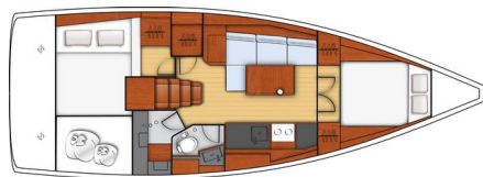
- Versione 3 cabine